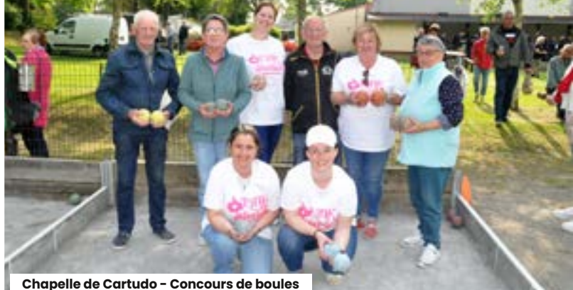
Chapelle de Cartudo - Concours de boules