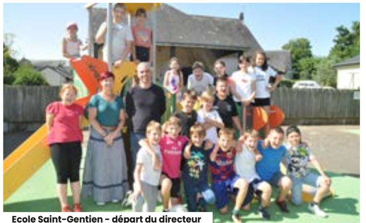
Ecole Saint-Gentien - départ du directeur