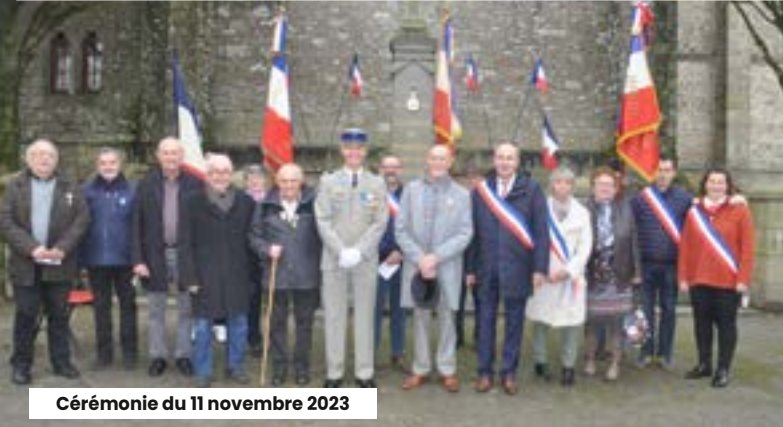
Cérémonie du 11 novembre 2023