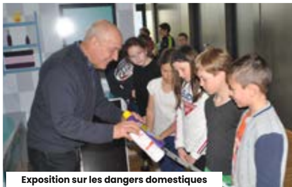
Exposition sur les dangers domestiques