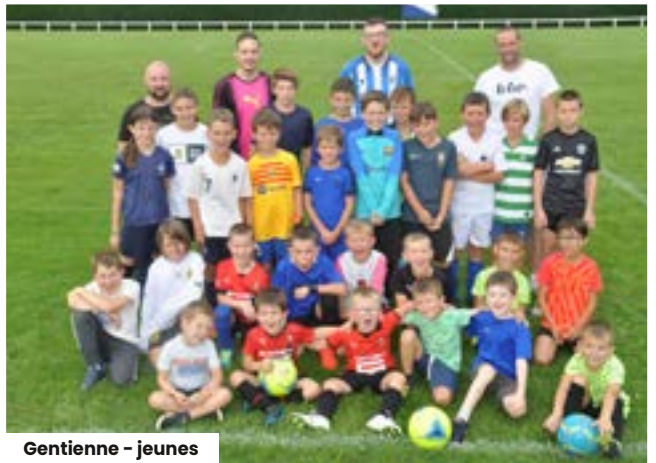
Gentienne - jeunes