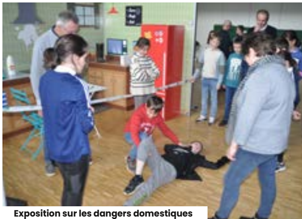
Exposition sur les dangers domestiques